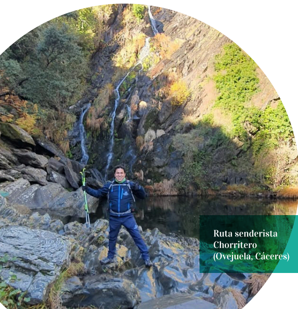
Ruta senderista Chorrintero (Ovejuela, Cáceres)

Seleccionadas por el equipo de Cantueso Experience, nuestras actividades están adaptadas a todos los niveles . Por ello, nuestro objetivo principal es crear experiencias vitales que resulten gratas e inolvidables para todos nuestros clientes/as.